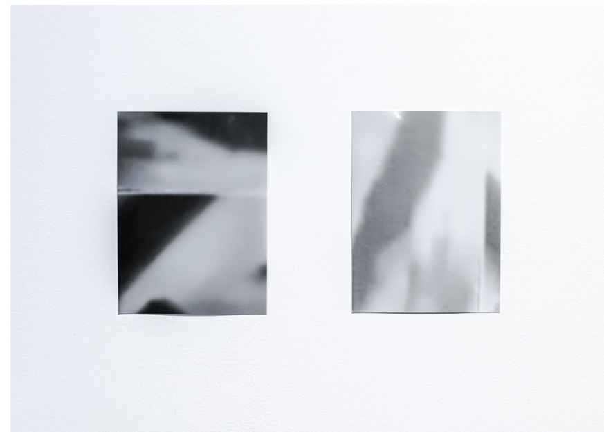
RUIDO BLANCO I-II (DIGITAL EFFLUVIA) 2025 Rayograma sobre papel FB Foma Variant. Obra única. 24 x 17,8 cm /ud.