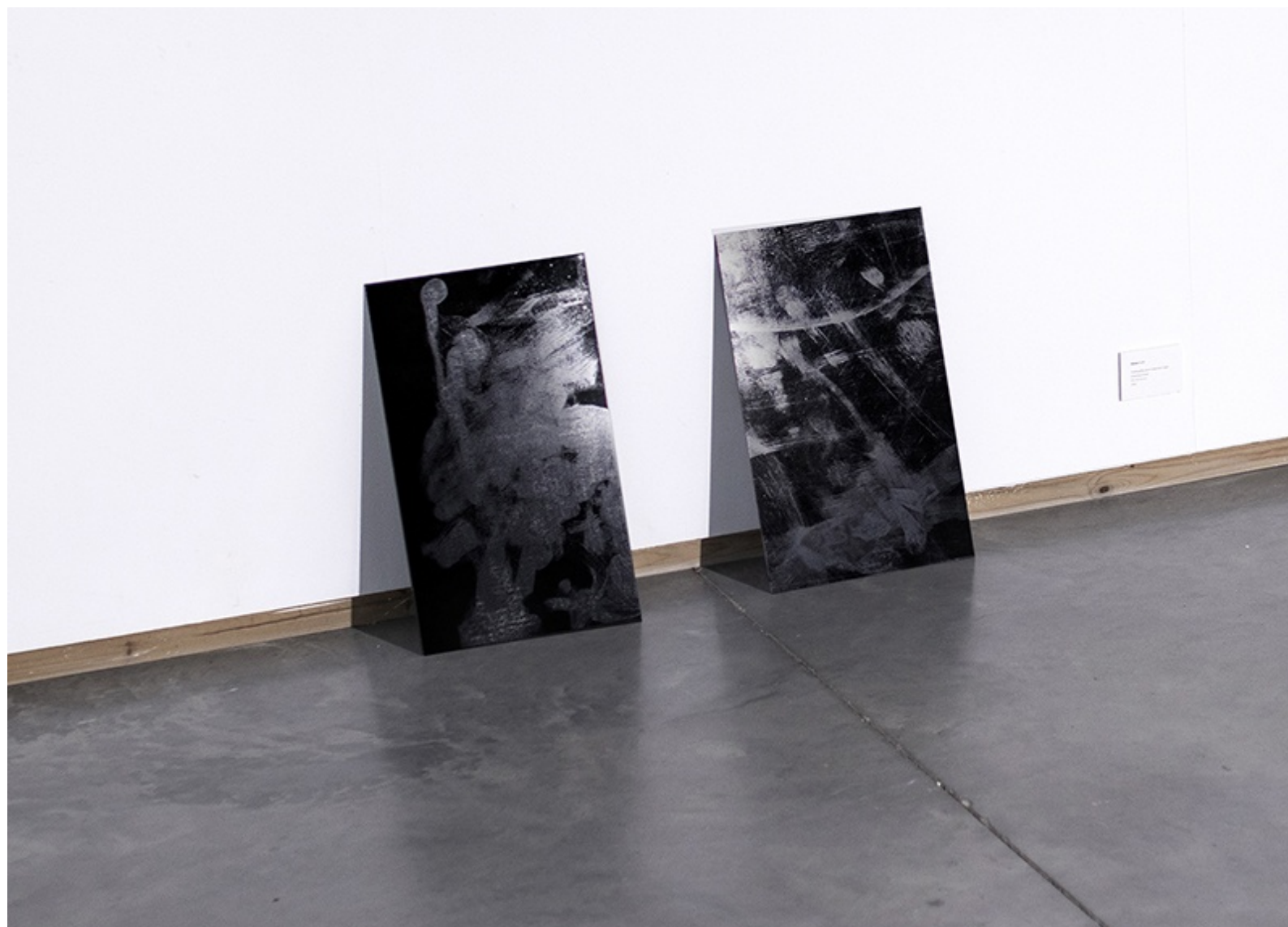
DESLIZA I-II 2024 Fotolitografía sobre metacrilato negro. Estampas únicas. 50 x 30 cm / ud.