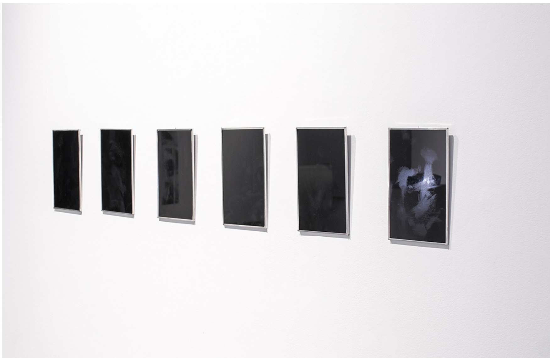
GESTO I-VI 2024 Fotolitografía sobre metacrilato negro. Edición: 2 26 x 16 cm /ud.