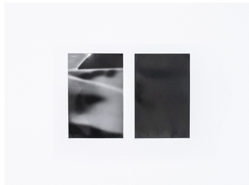
SIN TÍTULO I-II (DIGITAL EFFLUVIA) 2025 Rayograma sobre papel FB Foma Variant. Obra única. 18 x 11,5 cm /ud.