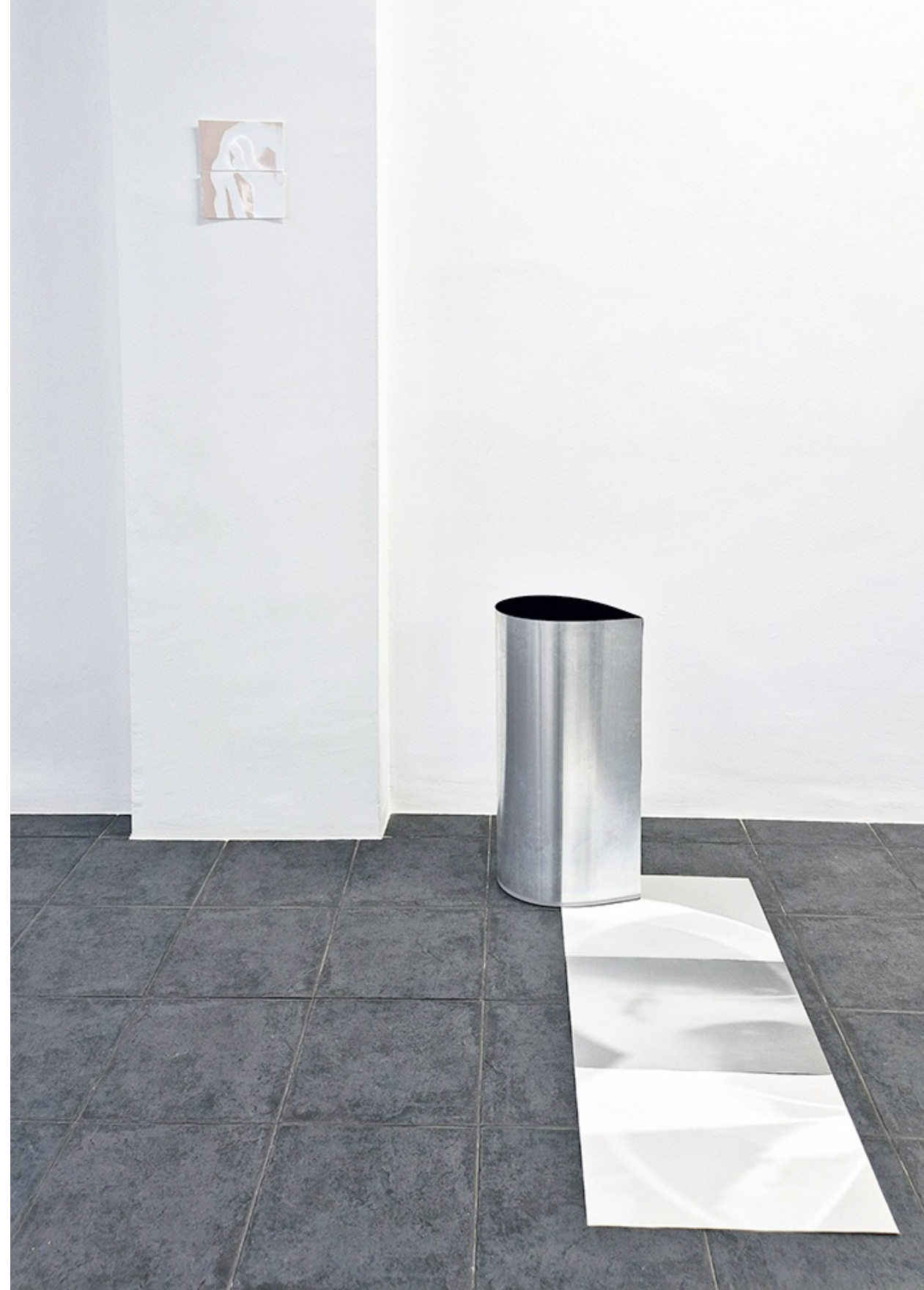
LUZ RESIDUAL (DIGITAL EFFLUVIA) 2025 Instalación, plancha de aluminio curvada, espejo y rayograma sobre papel fotográfico FB Fomabrom Variant.