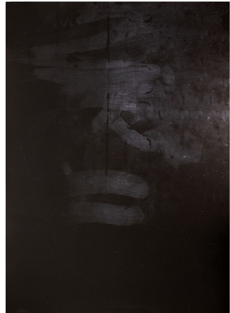
HUELLAS DE INTERACCIÓN 2024 Fotolitografía sobre metacrilato negro. Estampa única. 70 x 50 cm