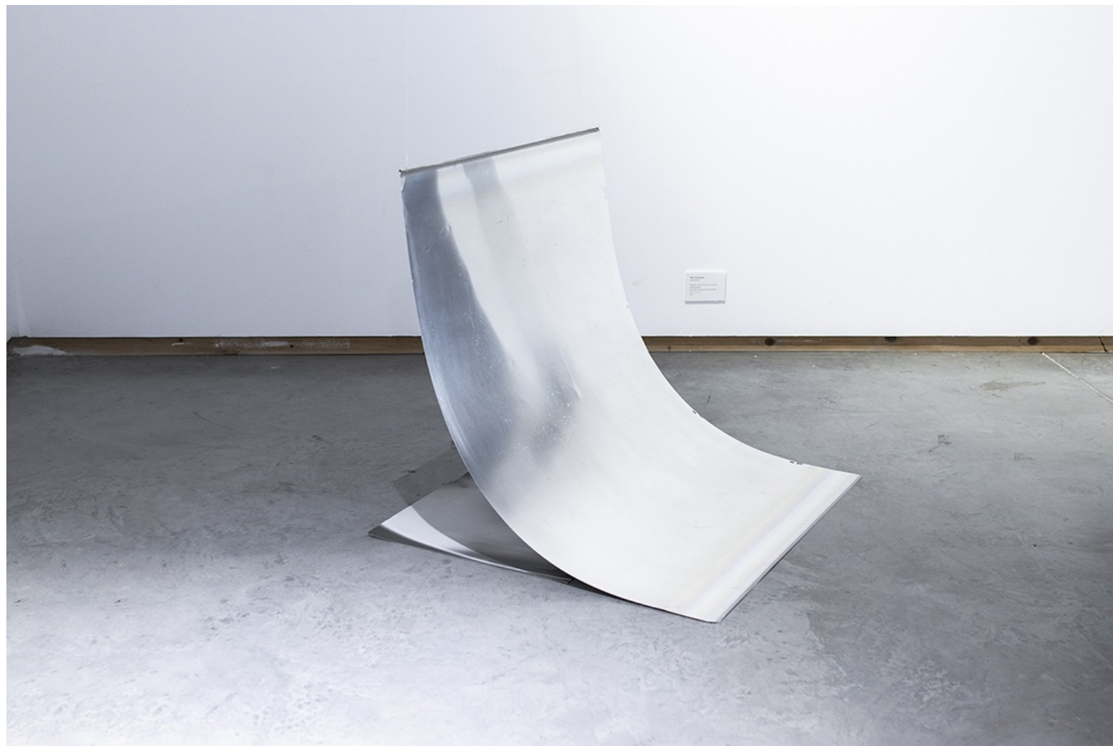
MIRAR EN PENUMBRA (DIGITAL EFFLUVIA) 2025 Instalación, plancha de aluminio curvada y papel fotográfico Rayograma sobre papel FB Foma Variant. 100 x 75 x 45 cm