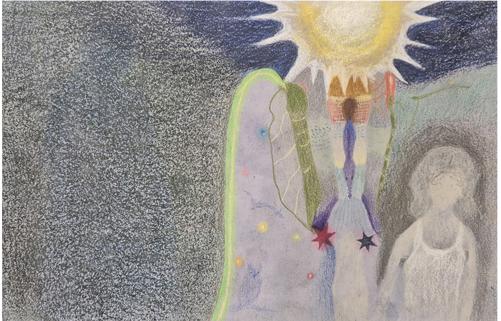
SIN TÍTULO 2026 Lápices, pasteles y acrílico sobre papel sumi-e. 16 x 25 cm