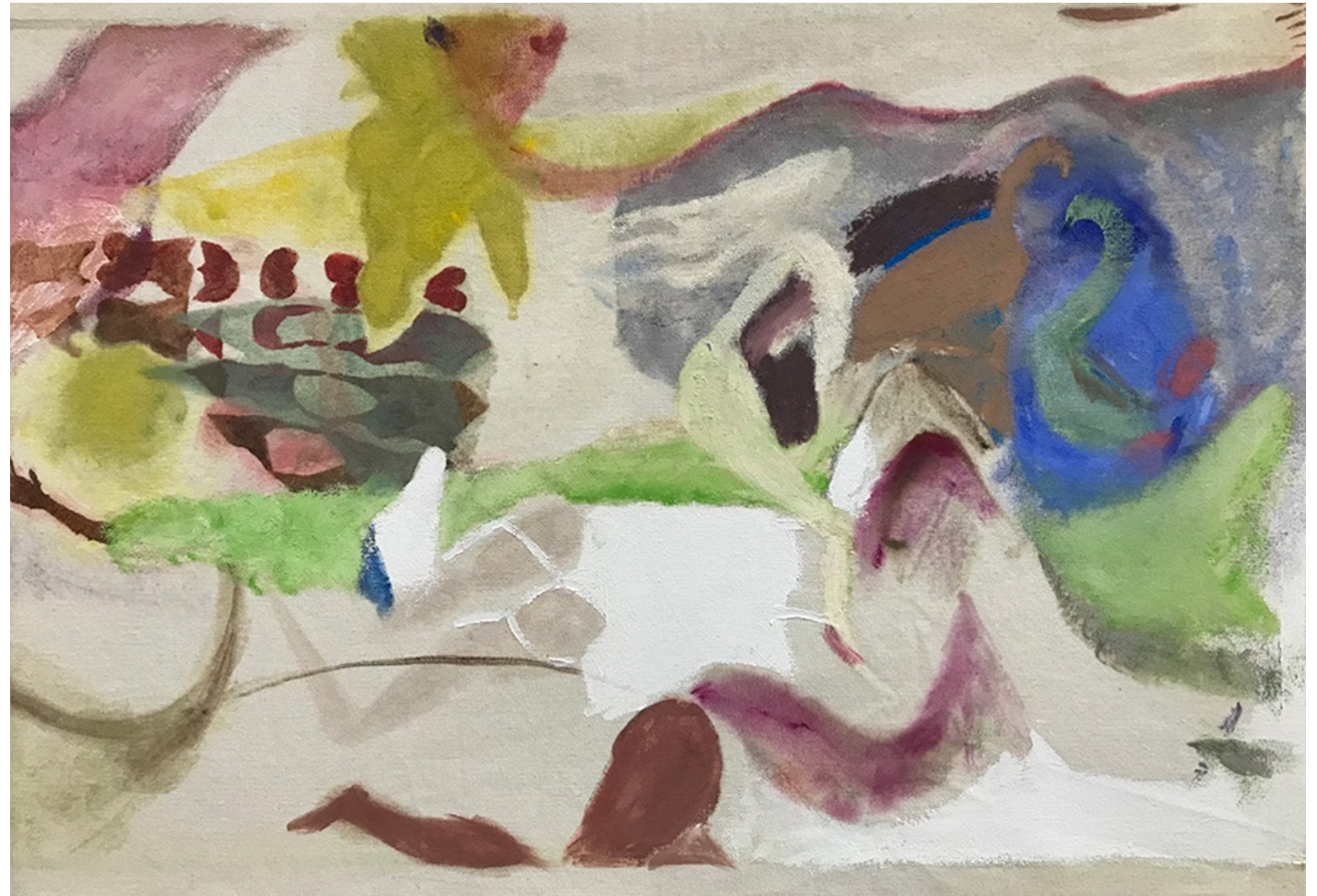
GOING PLACES 2022 Lápices y óleo sobre loneta. 46 x 65 cm