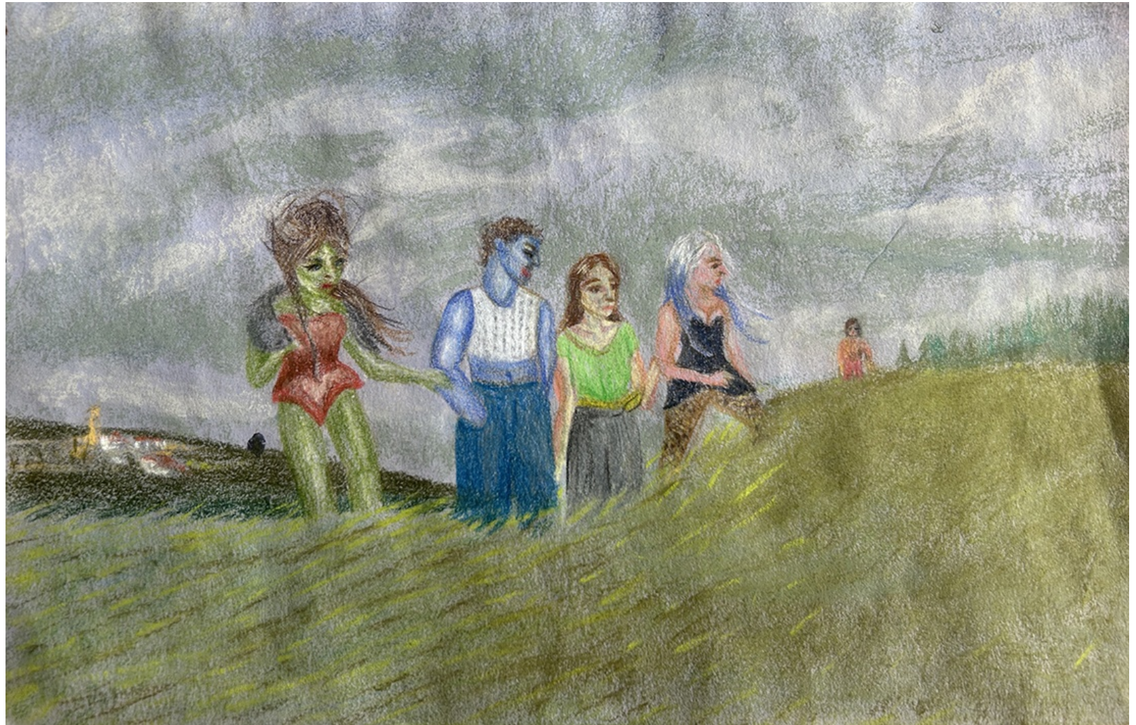
BRAT 2026 Lápices, pasteles y acrílico sobre papel sumi-e. 16 x 25 cm