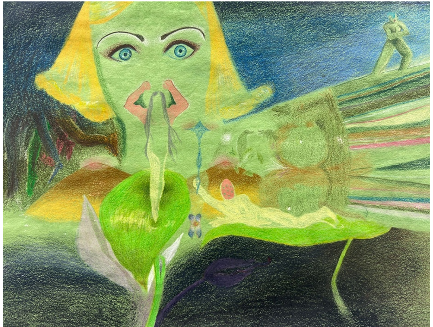
CHOOSE YOUT FIGHTER 2024 Lápices y acrílico sobre papel sumi-e. 25 x 32,2 cm