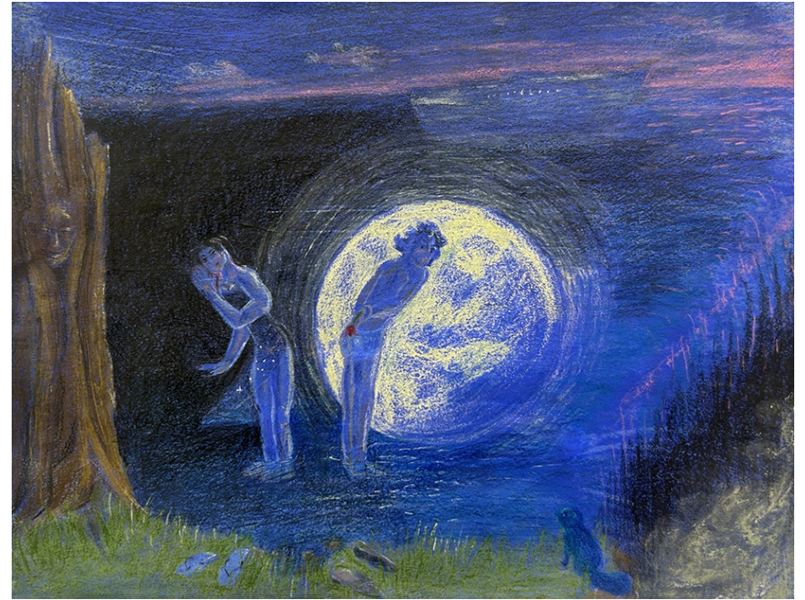
CREATURES OF THE NIGHT 2025 Lápices, pasteles y acrílico sobre papel sumi-e. 25 x 32,2 cm