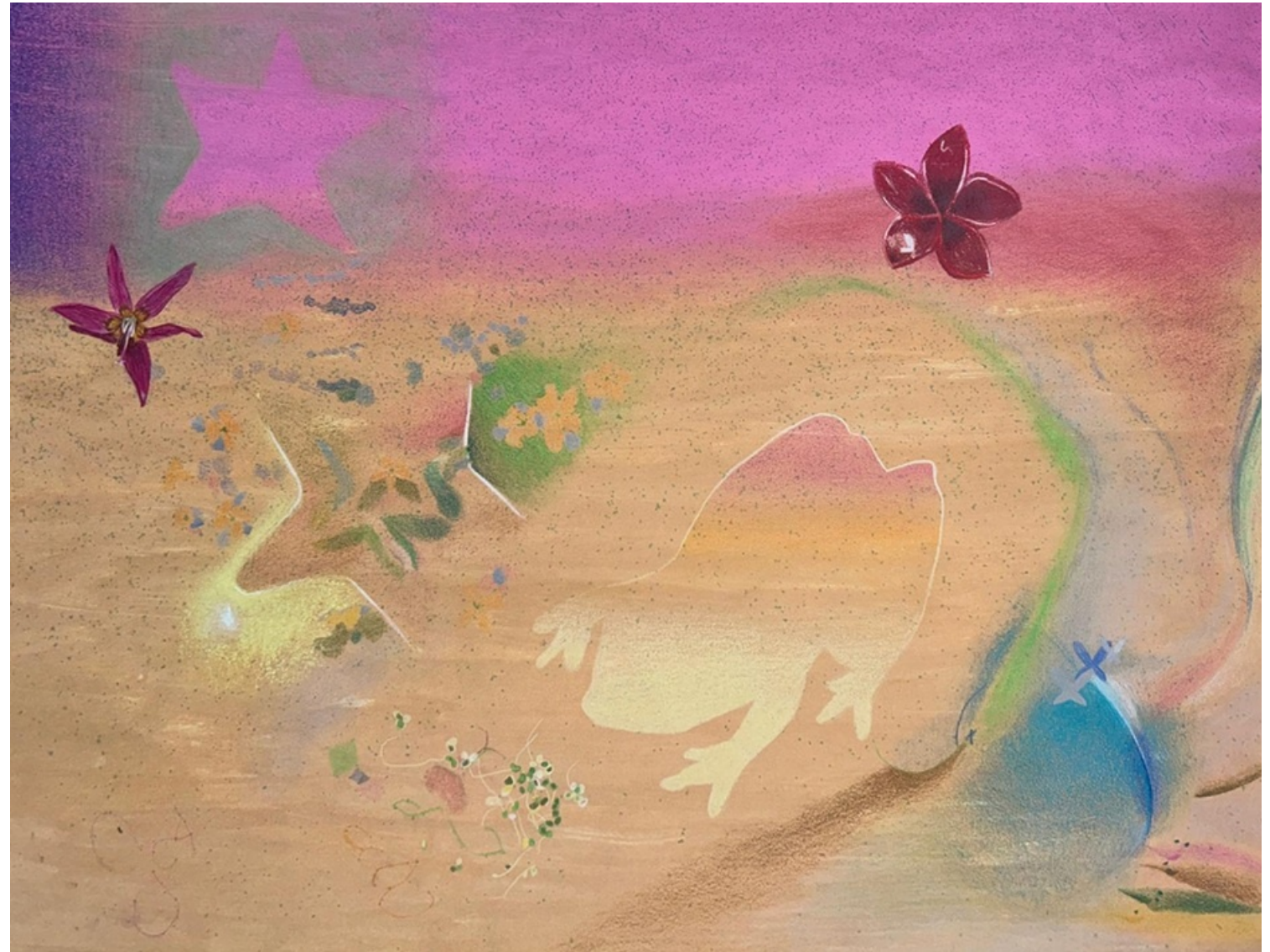
MIDNIGHT SUN 2025 Lápices, pasteles y acrílico sobre papel sumi-e. 50 x 64 cm