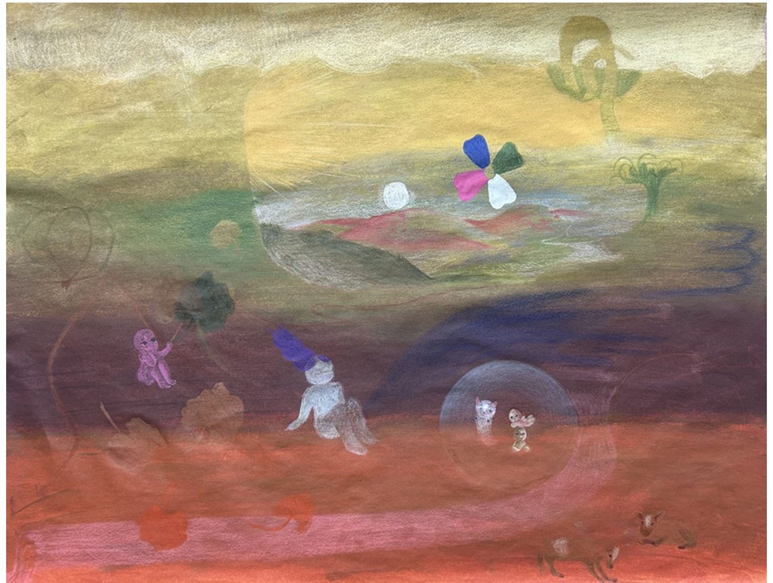
WILD PLANET 2024 Lápices y acrílico sobre papel sumi-e. 50 x 64 cm