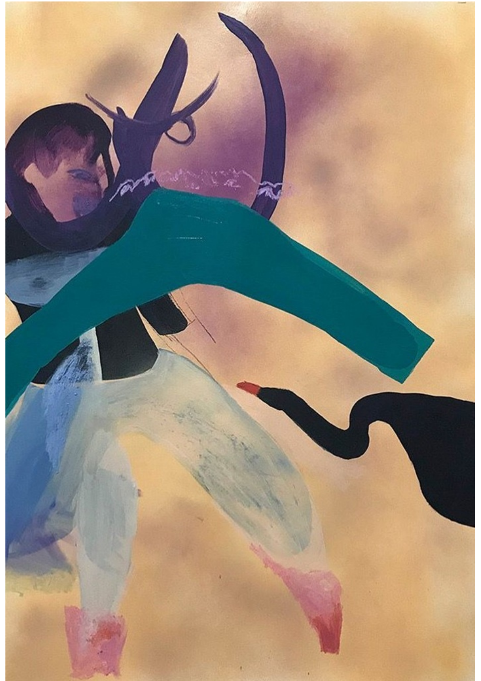
ES QUE VINE ANTES DE TI 2022 Acrílico, spray, látex y óleo sobre papel. 100 x 70 cm