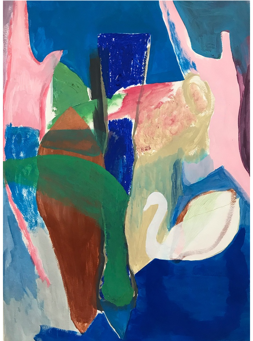
QUIERO QUE VENGAS 2021 Acrílico y óleo sobre papel. 100 x 70 cm