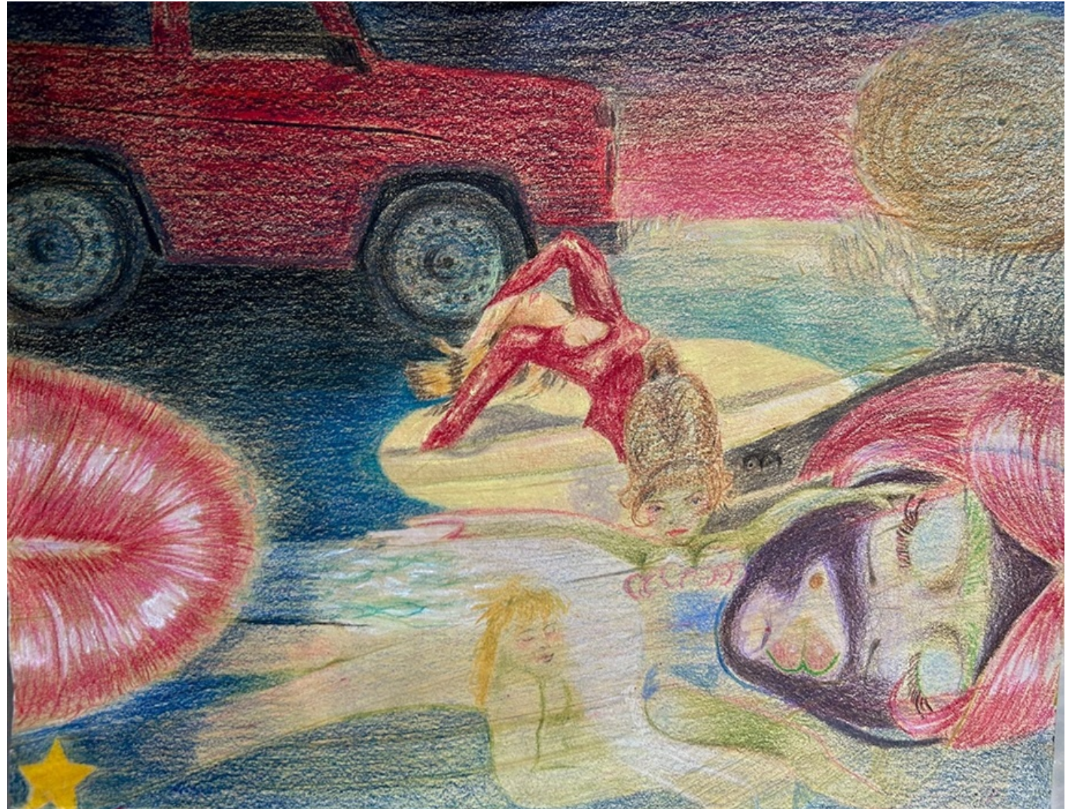
ROCK LOBSTER 2026 Lápices, pasteles y acrílico sobre papel sumi-e. 25 x 32,2 cm