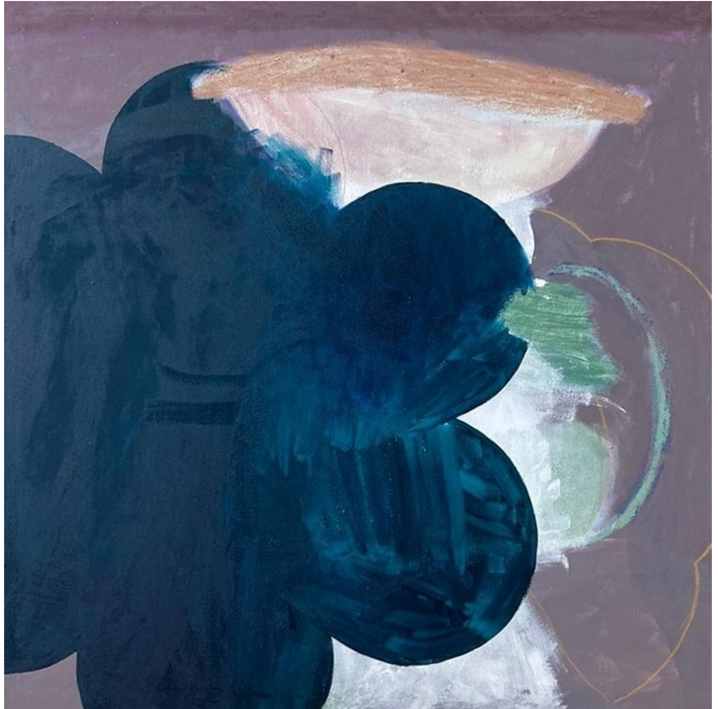
DREAMING 2023 Acrílico, lápiz y óleo sobre loneta. 100 x 100 cm