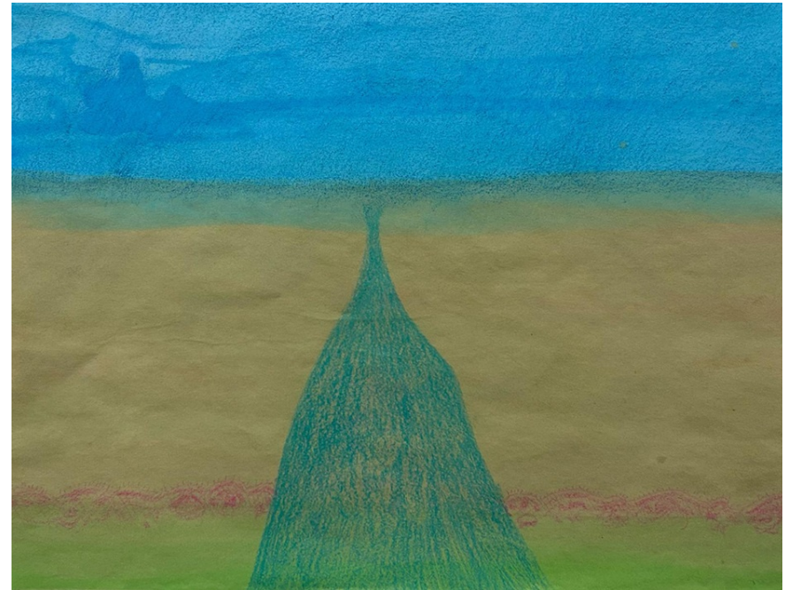
BRITNEY 2024 Lápices y acrílico sobre papel sumi-e. 25 x 32,2 cm