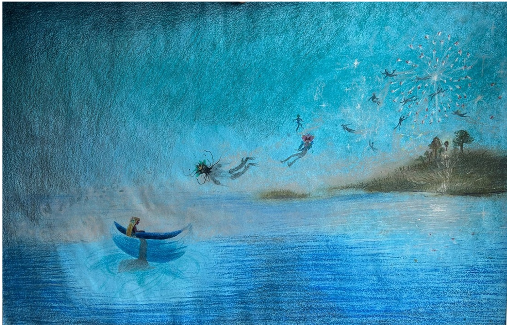
LEJOS DE ULISES Y LAS SIRENAS 2026 Lápices, pasteles y acrílico sobre papel sumi-e. 32,2 cm x 50 cm