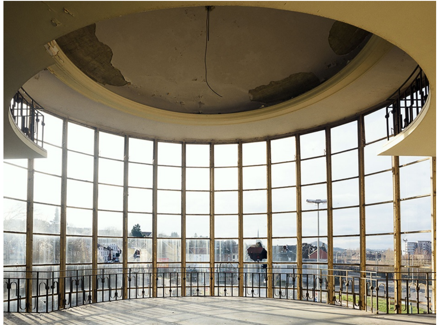
VIDRIERA (Charleroi) 2014 Impresión digital directa con tintas UV s/ dibond Edición 5 ejemplares 90 x 120 cm