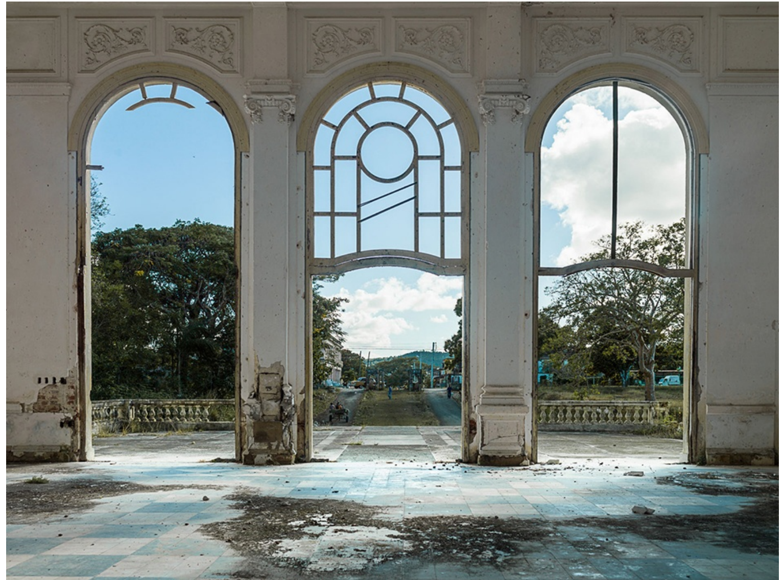
LOS BAÑOS (Cuba) 2017 Impresión digital directa con tintas UV s/ dibond Edición 5 ejemplares 90 x 120 cm