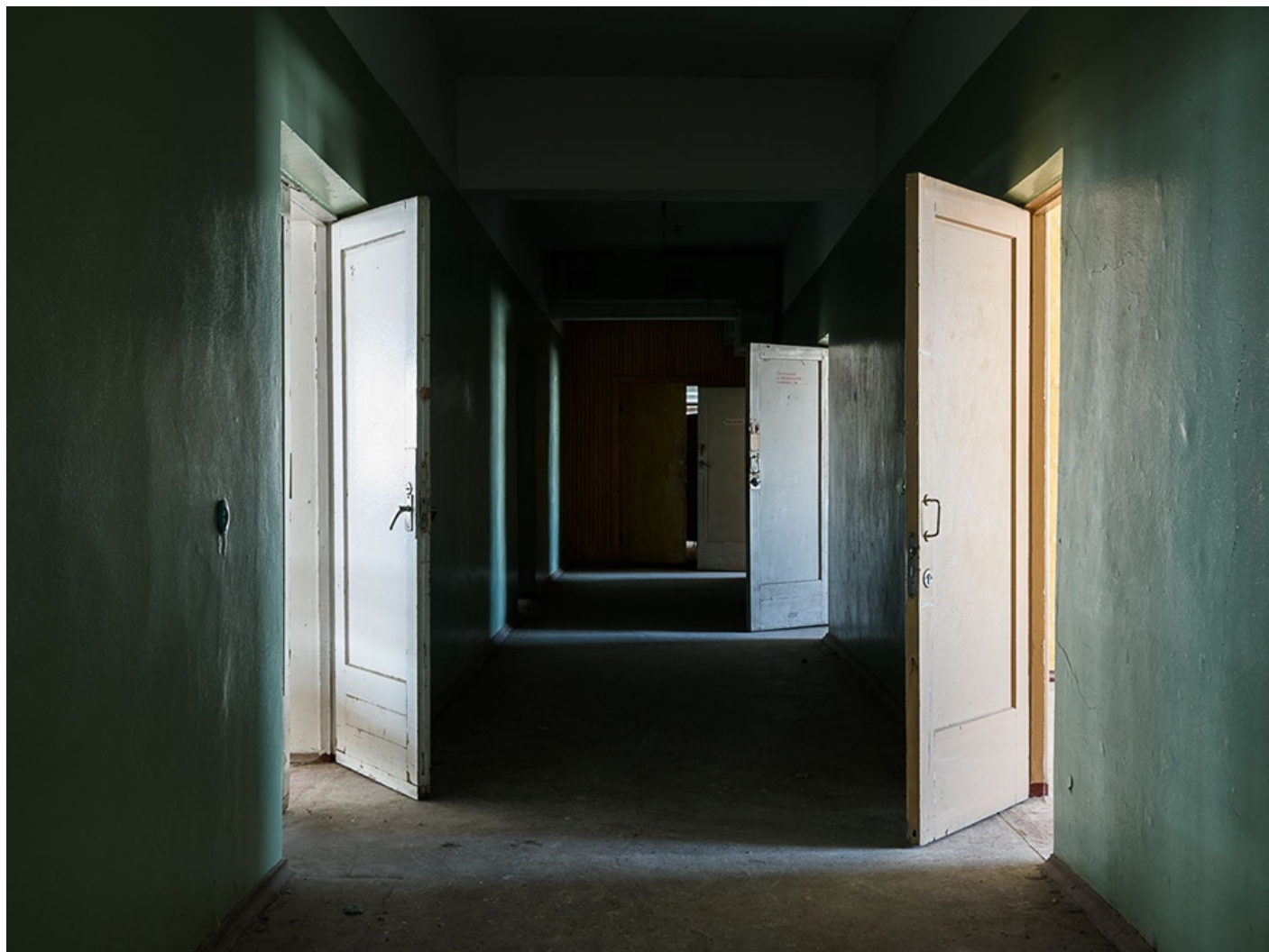
DISTRIBUIDOR (Svalbard) 2016 Impresión digital directa con tintas UV s/ dibond Edición 5 ejemplares 75 x 100 cm