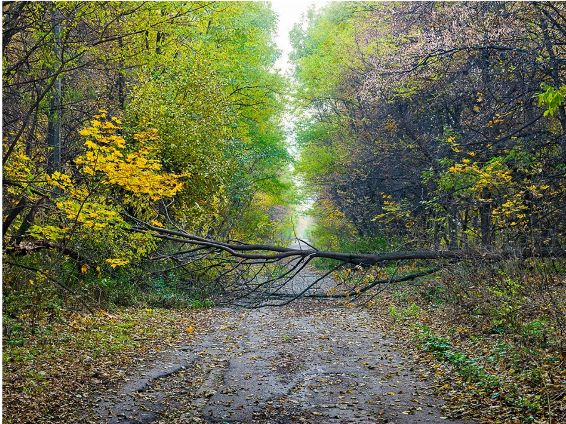
MOCT (Chernobyl, Ucrania.) 2014 Impresión digital directa con tintas UV s/ dibond Edición 5 ejemplares 120 x 160 cm