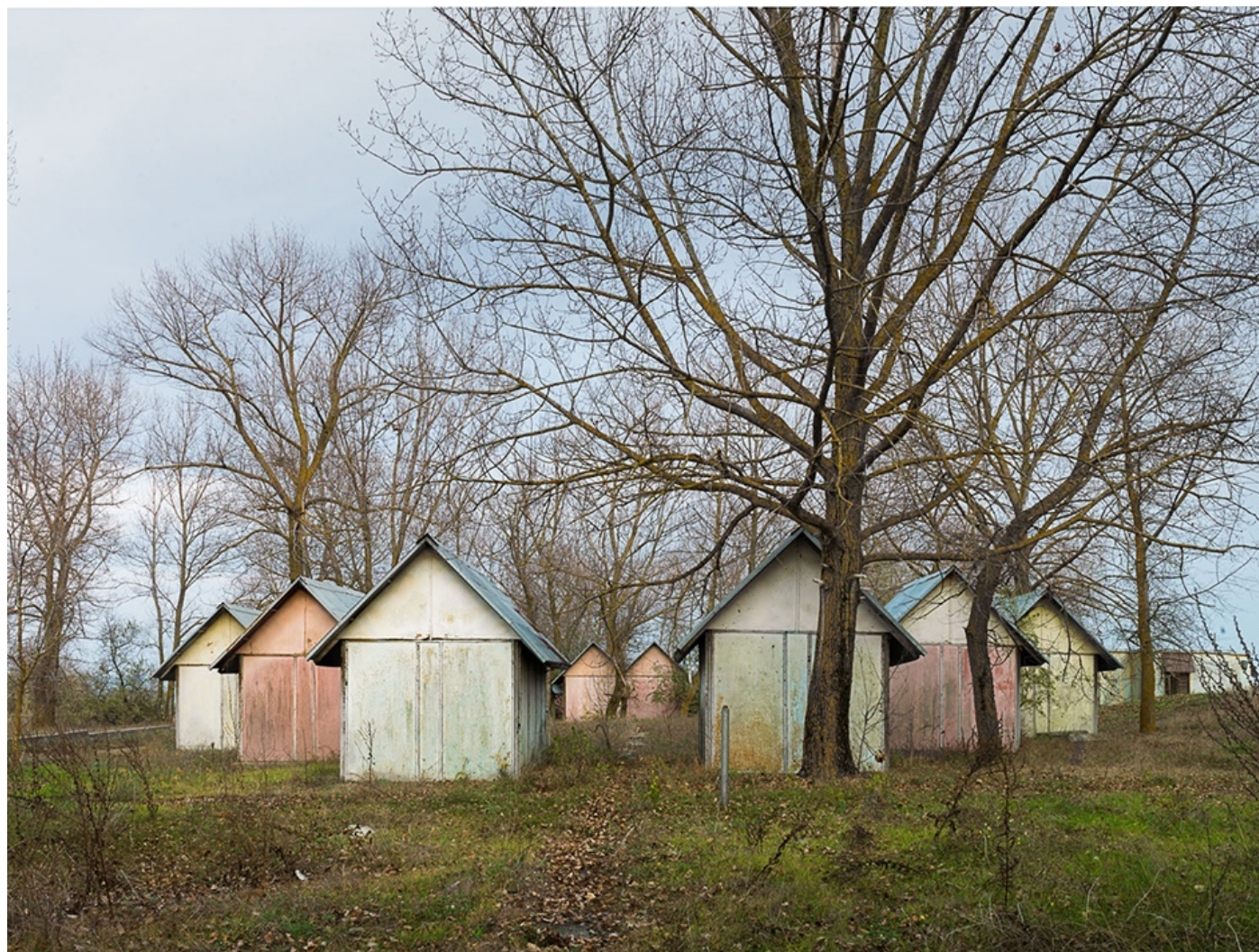
BULGARIAN CAMP (Bulgaria) 2015 Impresión digital directa con tintas UV s/ dibond Edición 5 ejemplares 75 x 100 cm