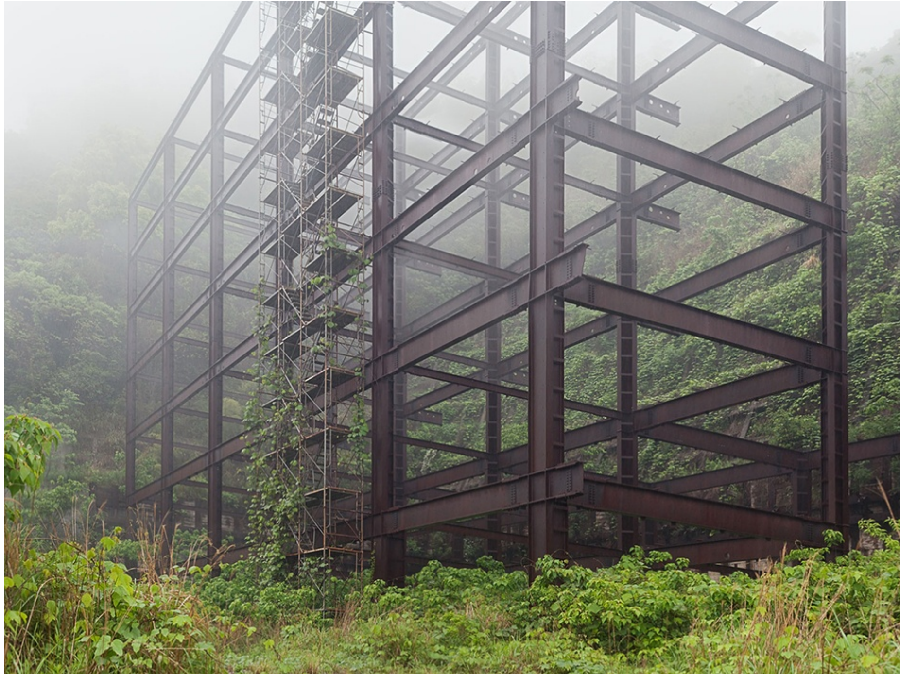
GUIA (Japón) 2010 Impresión digital directa con tintas UV s/ dibond Edición 5 ejemplares 120 x 160 cm