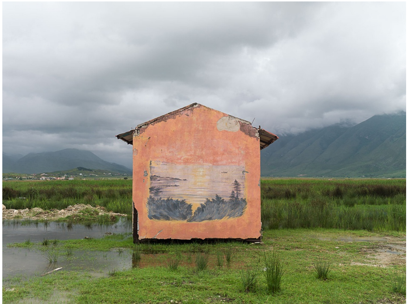
DECO (Albania) 2012 Impresión digital directa con tintas UV s/ dibond Edición 5 ejemplares 75 x 100 cm