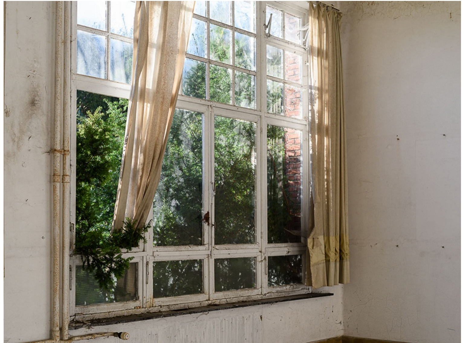
SIN TÍTULO (Bélgica) 2015 Impresión digital directa con tintas UV s/ dibond Edición 5 ejemplares 90 x 120 cm