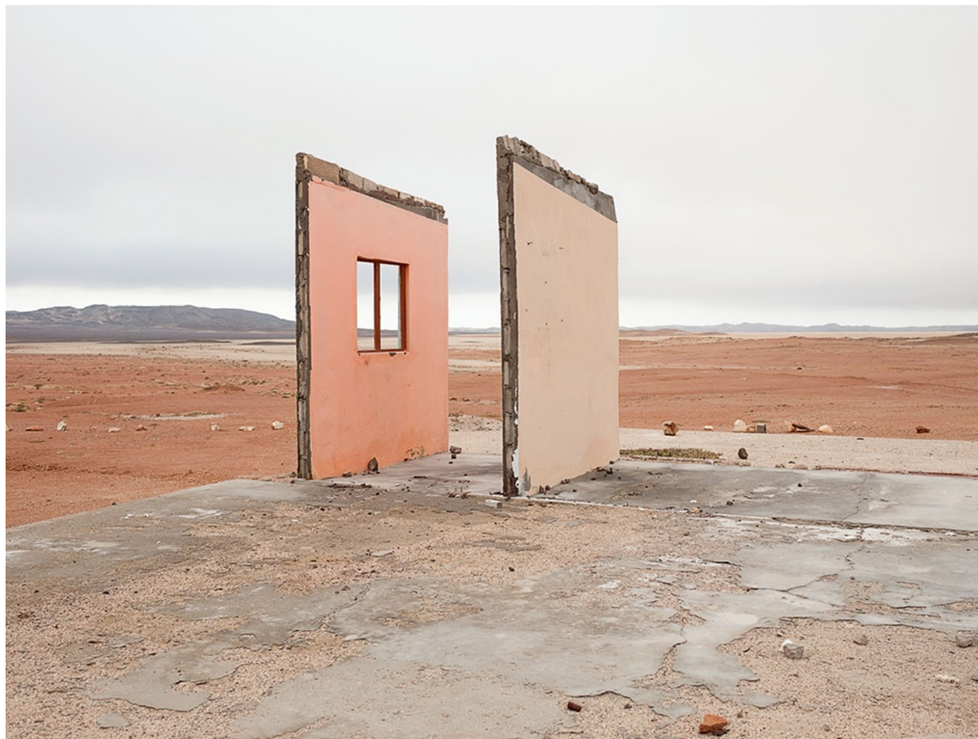
SIN TÍTULO (Namibia) 2008 Impresión digital directa con tintas UV s/ dibond Edición 5 ejemplares 75 x 100 cm