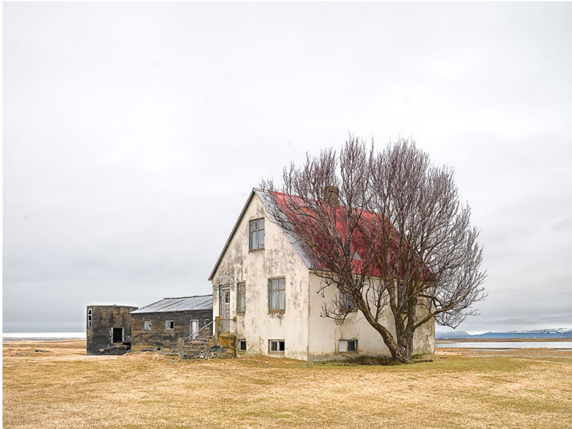
RAETUR II (Islandia) 2010 Impresión digital directa con tintas UV s/ dibond Edición 5 ejemplares 120 x 160 cm