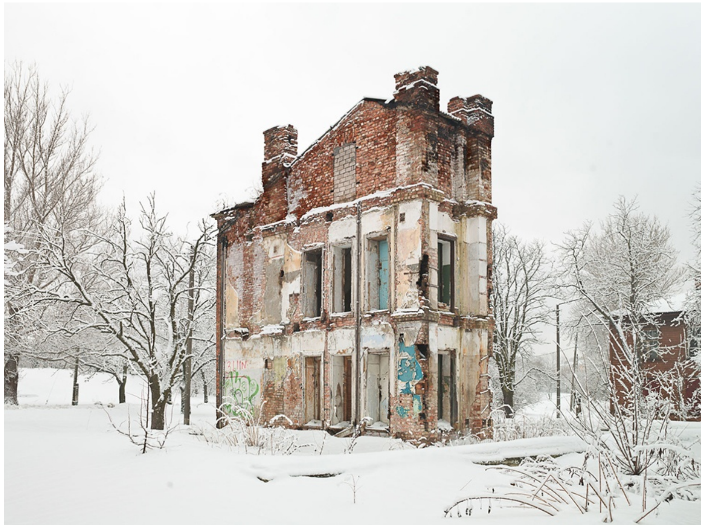
ALMA (Tallin, Estonia.) 2011 Impresión digital directa con tintas UV s/ dibond Edición 5 ejemplares 75 x 100 cm