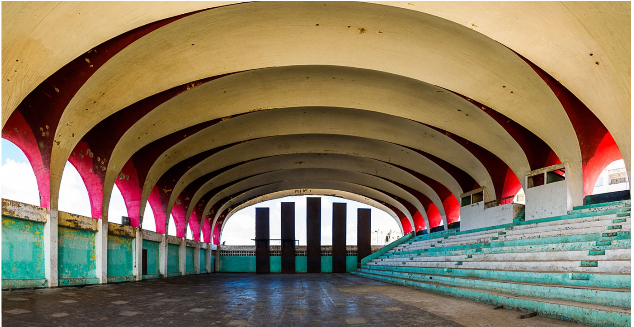
PABELLÓN (La Habana) 2017 Impresión digital directa con tintas UV s/ dibond Edición 5 ejemplares 82 x 160 cm