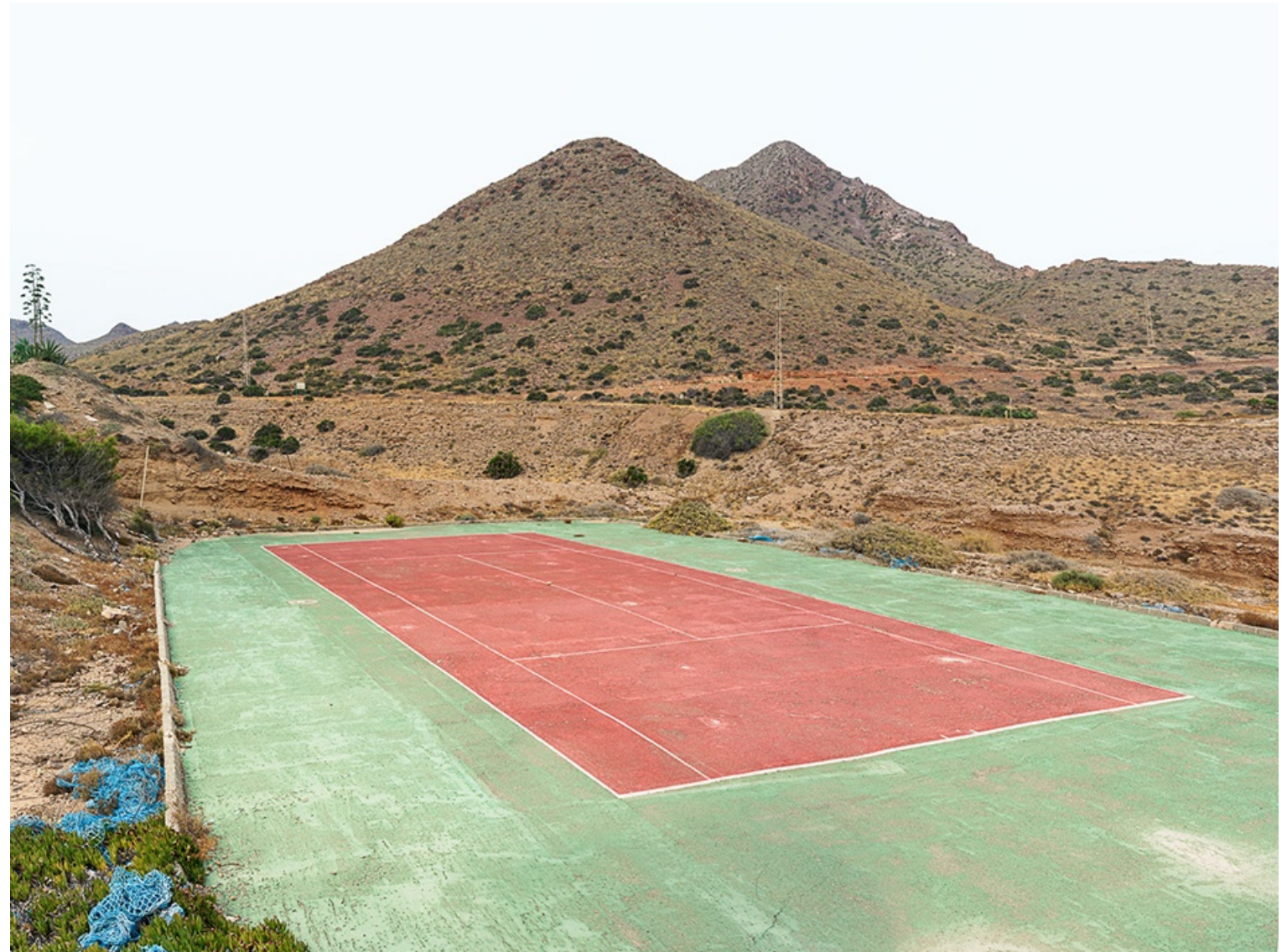
TENNIS (Almería) 2016 Impresión digital directa con tintas UV s/ dibond Edición 5 ejemplares 90 x 120 cm