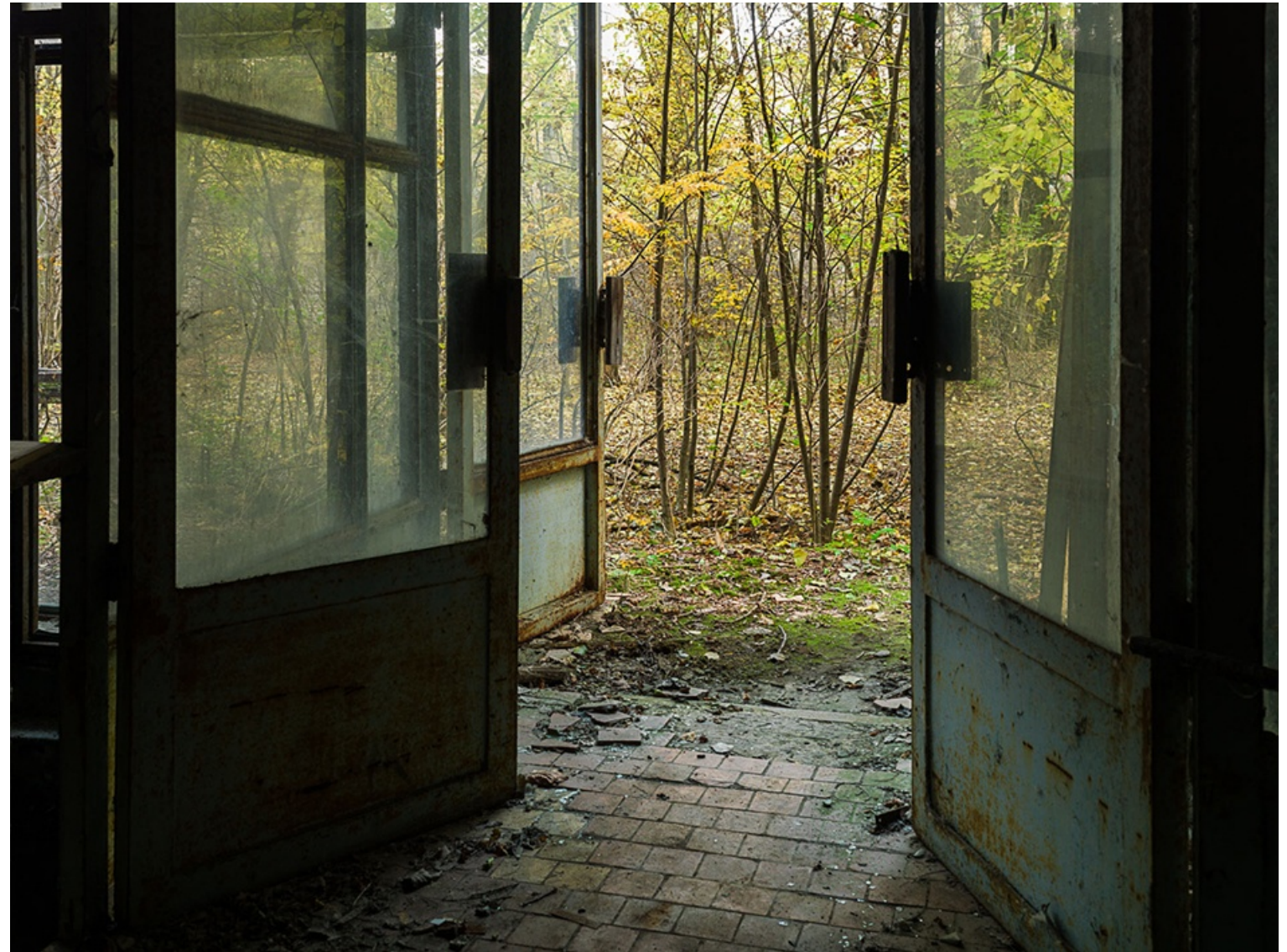
RESILENCE (Chernobyl, Ucrania.) 2014 Impresión digital directa con tintas UV s/ dibond Edición 5 ejemplares 90 x 120 cm