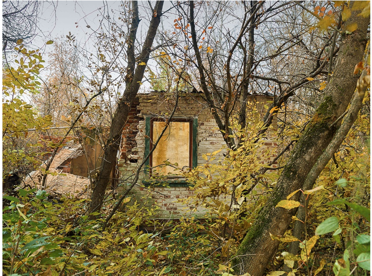
CERCA DE PRYPIAT (Ucrania) 2014 Impresión digital directa con tintas UV s/ dibond Edición 5 ejemplares 90 x 120 cm