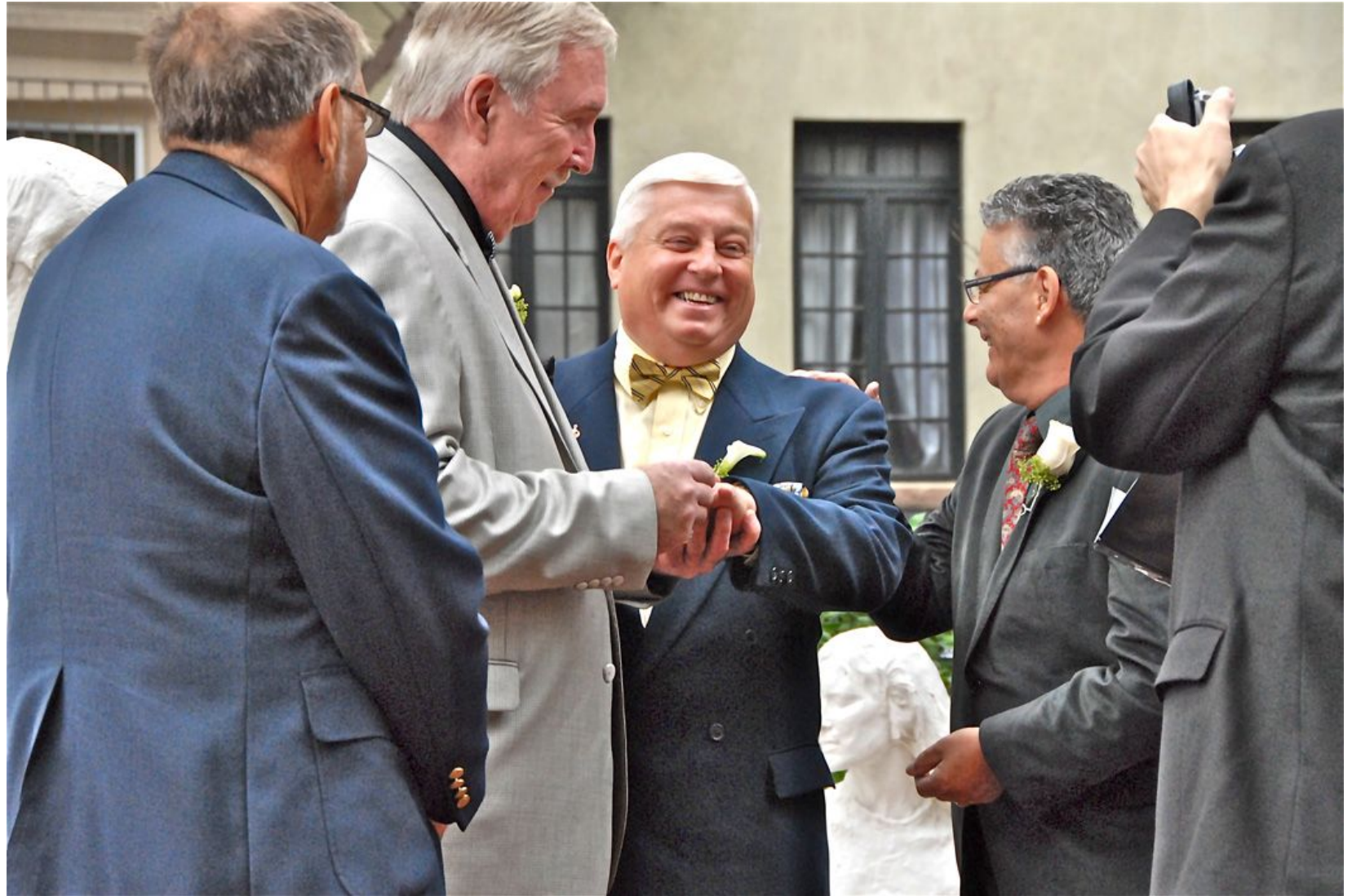
CEREMONIA EN CRISTOPHER PARK Impresión Digital en Sandwich Dibon blanco / Metacrilato / Bastidor Edición 1/3 - 70x100cm