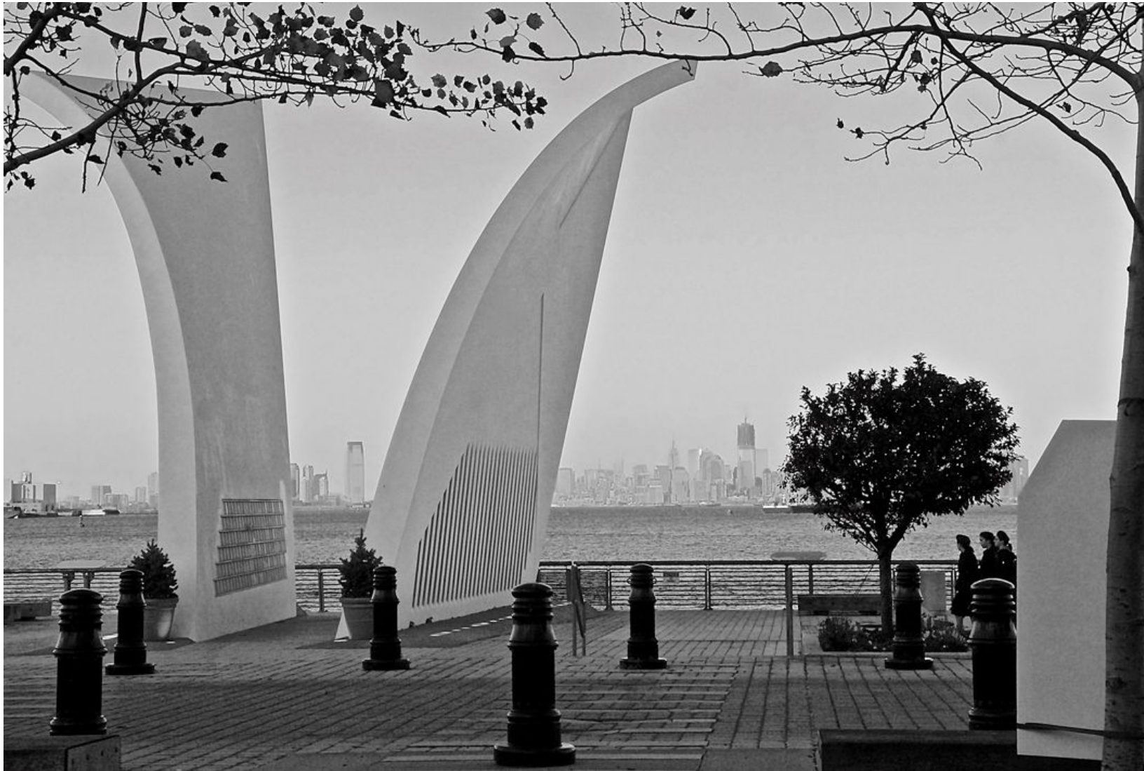
MEMORIAL EN STATEN ISLAND Impresión Digital en Sandwich Dibon blanco / Metacrilato / Bastidor Edición 1/3 - 70x100cm