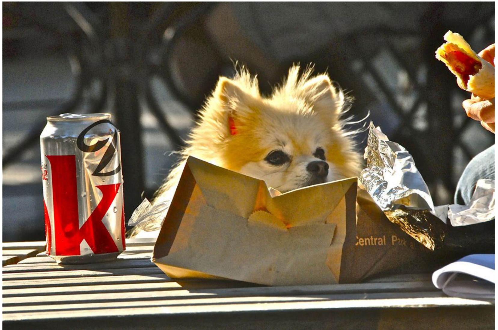
MASCOTA Y HOT DOG (CENTRAL PARK) Impresión Digital en Sandwich Dibon blanco / Metacrilato / Bastidor Edición 1/3 - 70x100cm