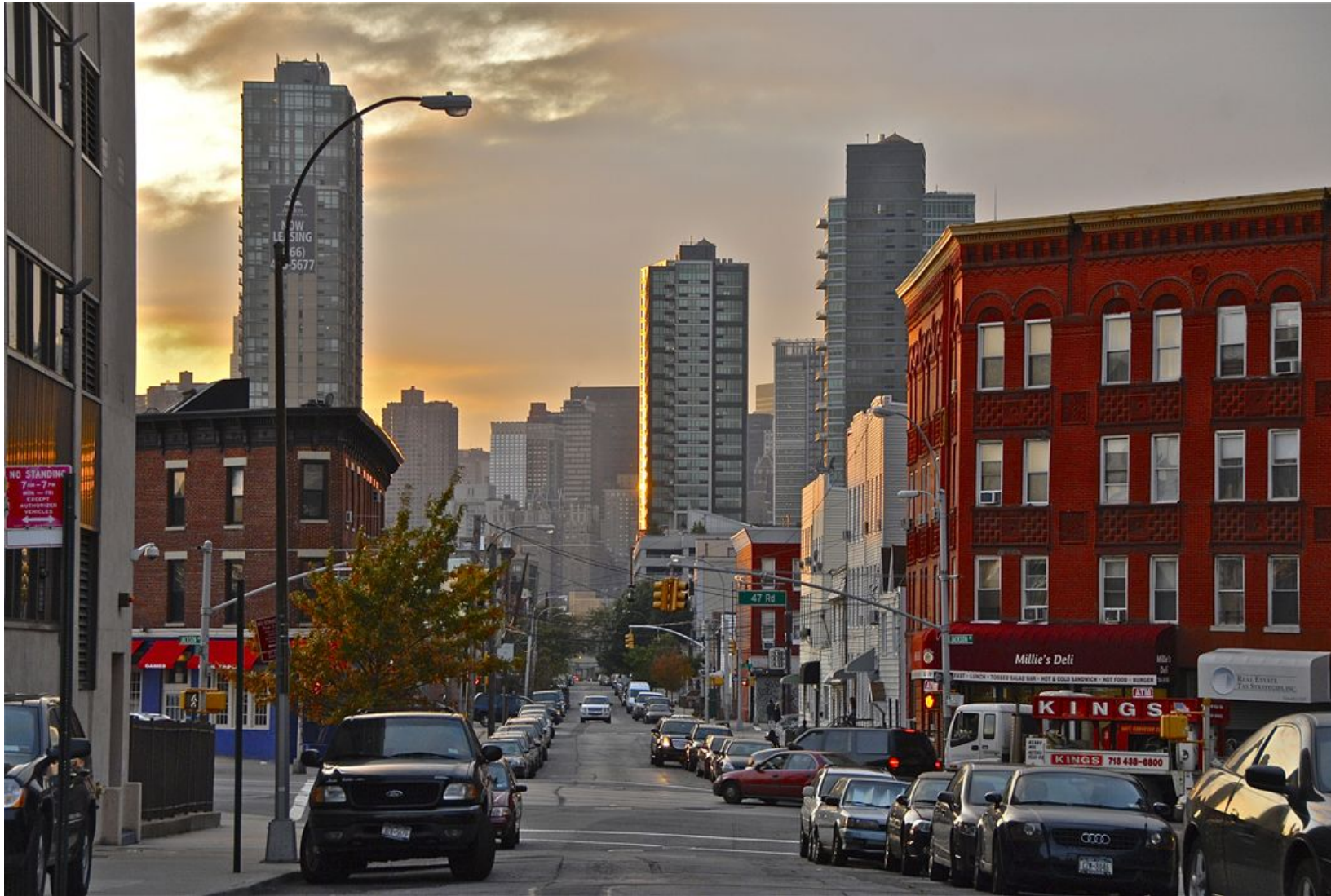
ATARDECER EN BROOKLYN Impresión Digital en Sandwich Dibon blanco / Metacrilato / Bastidor Edición 1/3 - 70x100cm