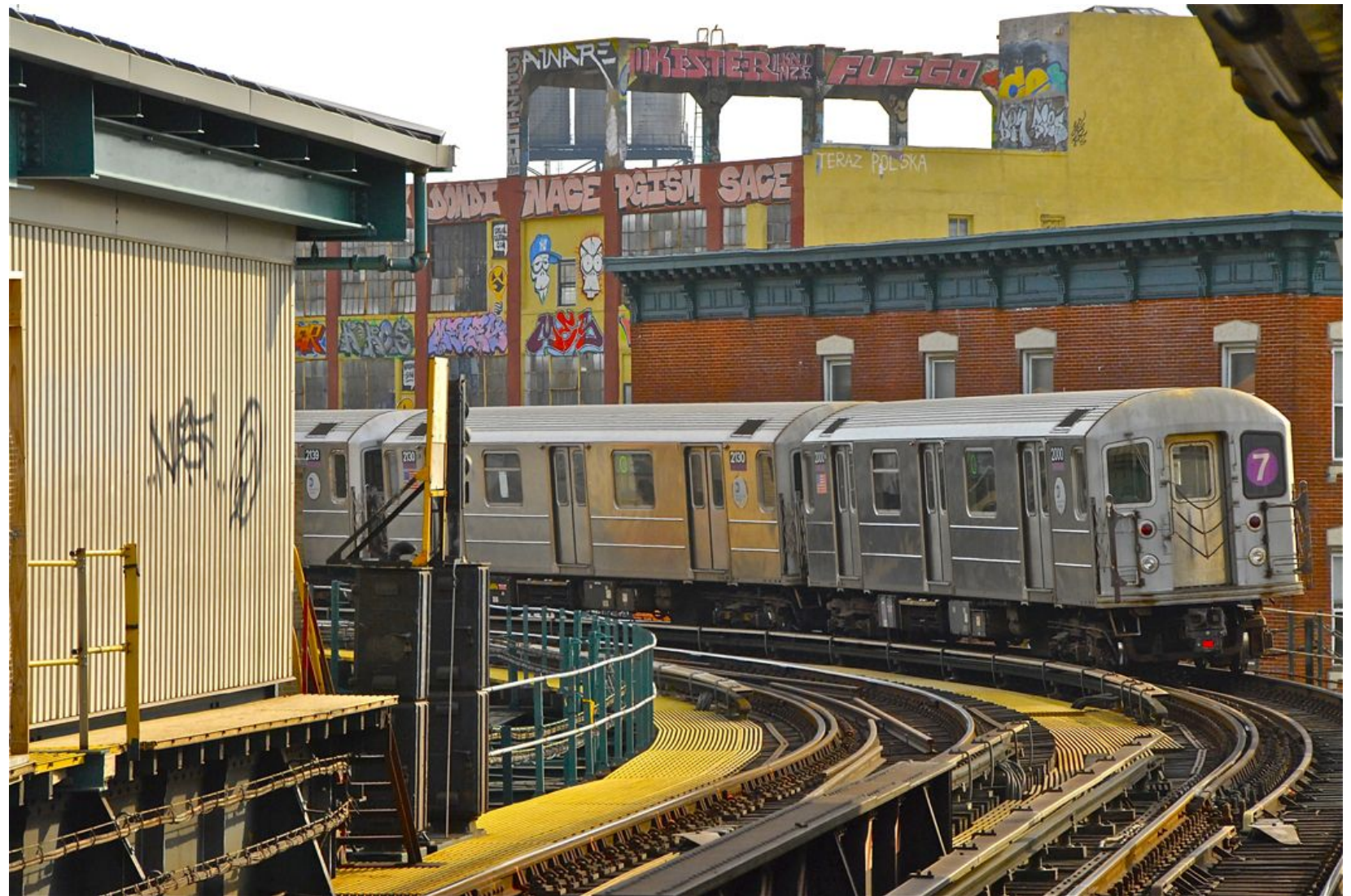
LA LÍNEA 7 POR QUEENS Impresión Digital en Sandwich Dibon blanco / Metacrilato / Bastidor Edición 1/3 - 70x100cm