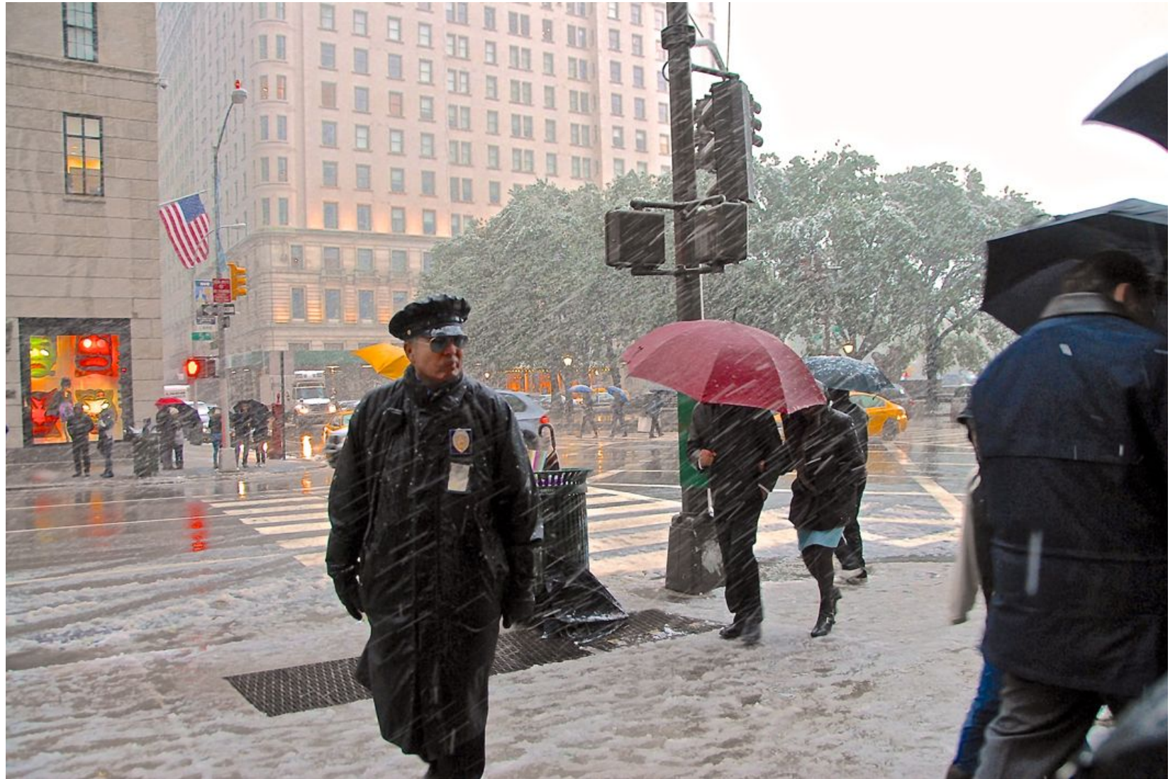
NIEVE EN LA 5ª AVENIDA Impresión Digital en Sandwich Dibon blanco / Metacrilato / Bastidor Edición 1/3 - 70x100cm