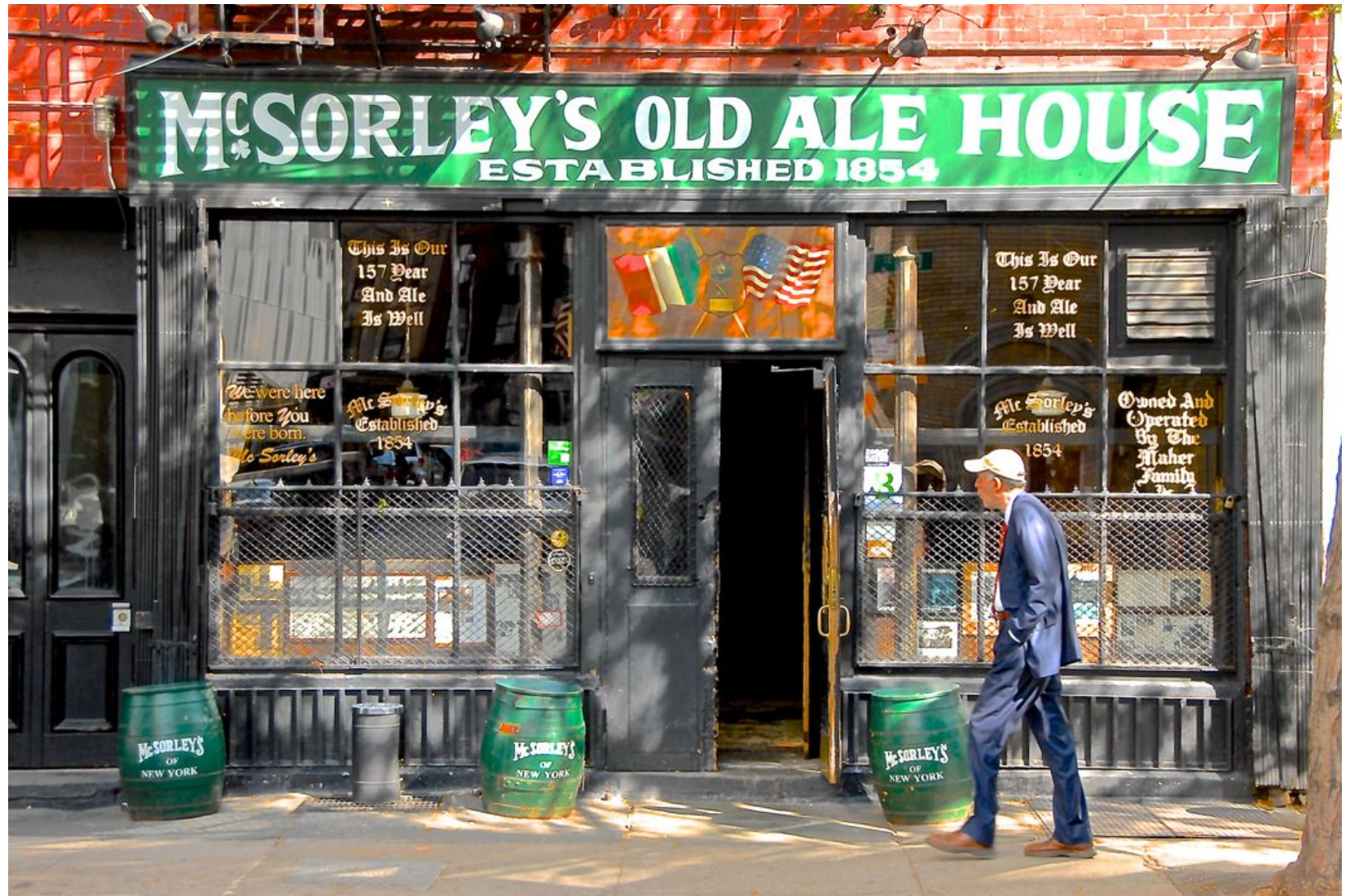
McSORLEY'S OLD ALE HOUSE Impresión Digital en Sandwich Dibon blanco / Metacrilato / Bastidor Edición 1/3 - 70x100cm