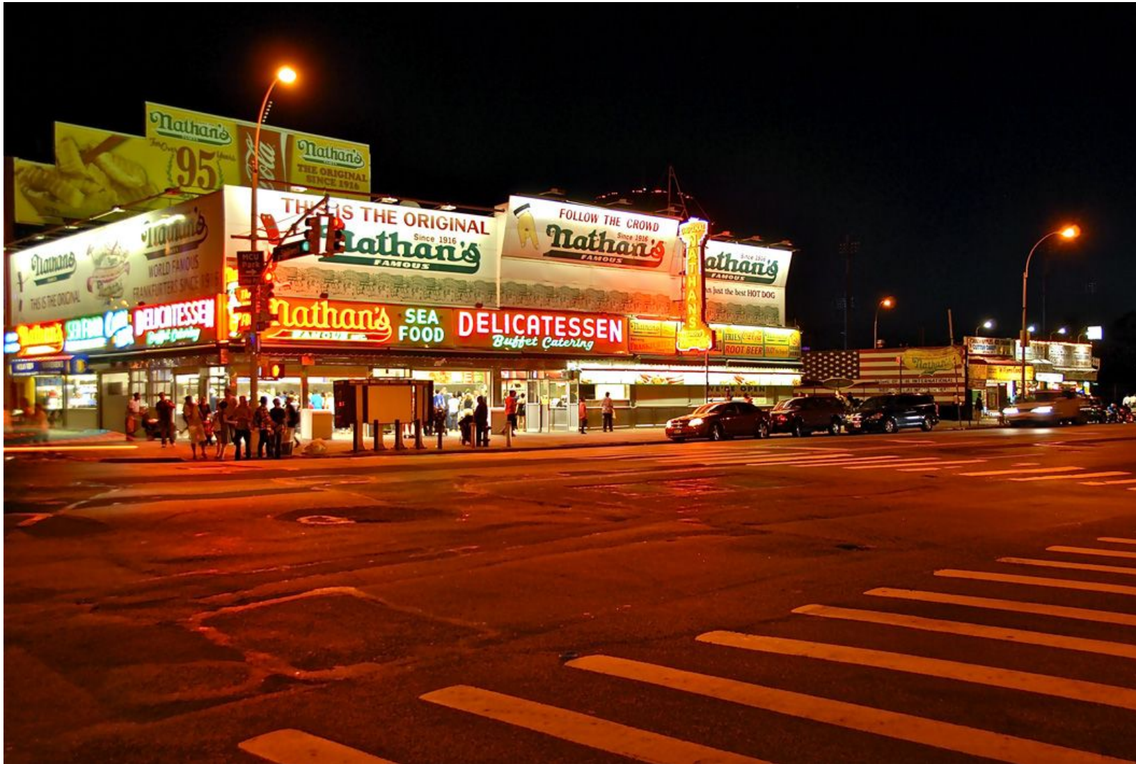
NATHAN'S SEAFOOD (CONEY ISLAND) Impresión Digital en Sandwich Dibon blanco / Metacrilato / Bastidor Edición 1/3 - 70x100cm