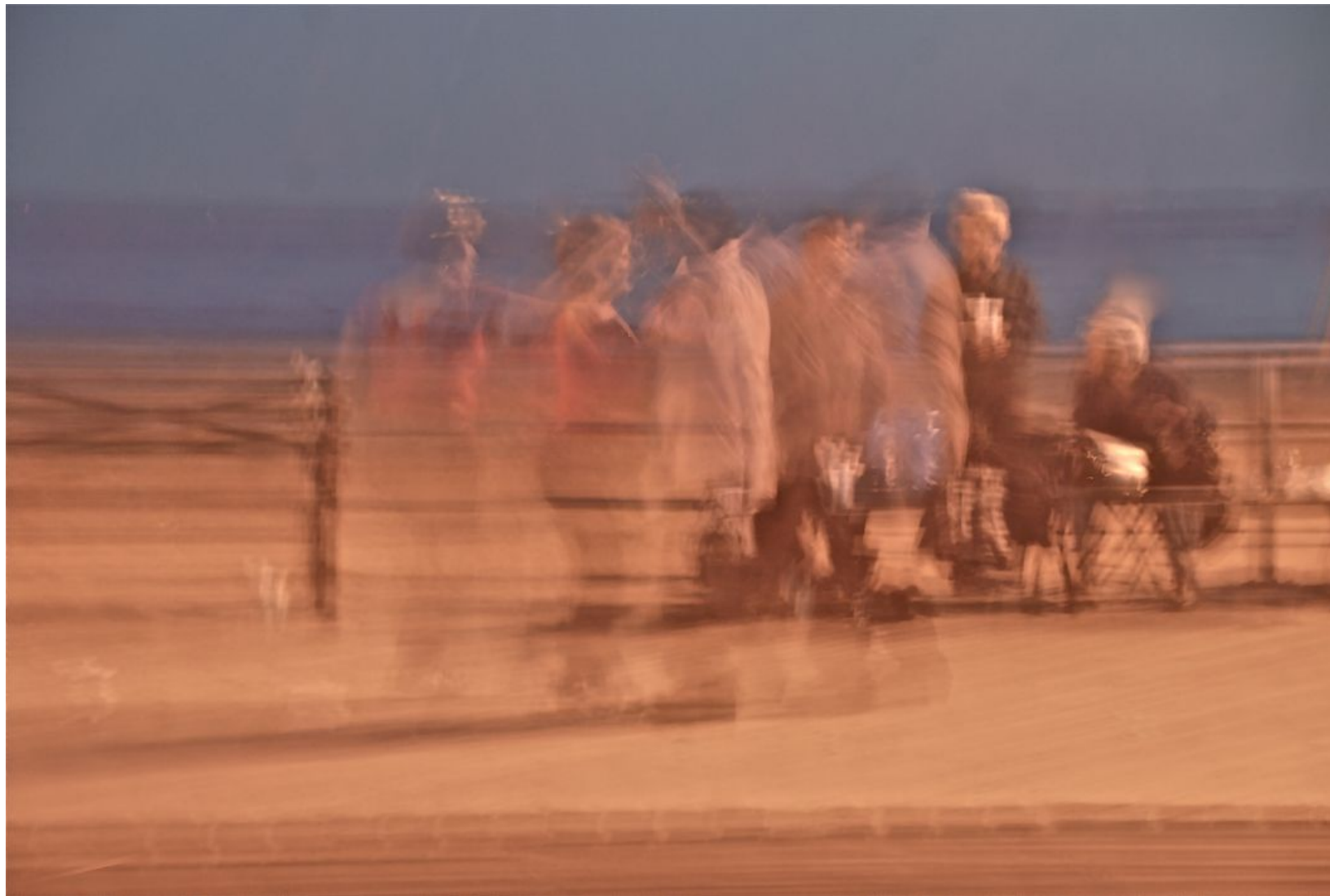
NOCTURNO (CONEY ISLAND) Impresión Digital en Sandwich Dibon blanco / Metacrilato / Bastidor Edición 1/3 - 100x170cm