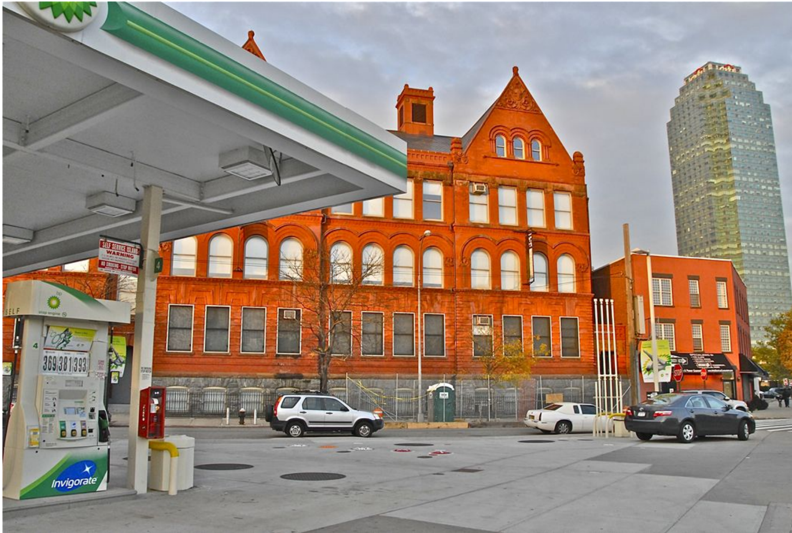
PS1 MOMA Impresión Digital en Sandwich Dibon blanco / Metacrilato / Bastidor Edición 1/3 - 70x100cm