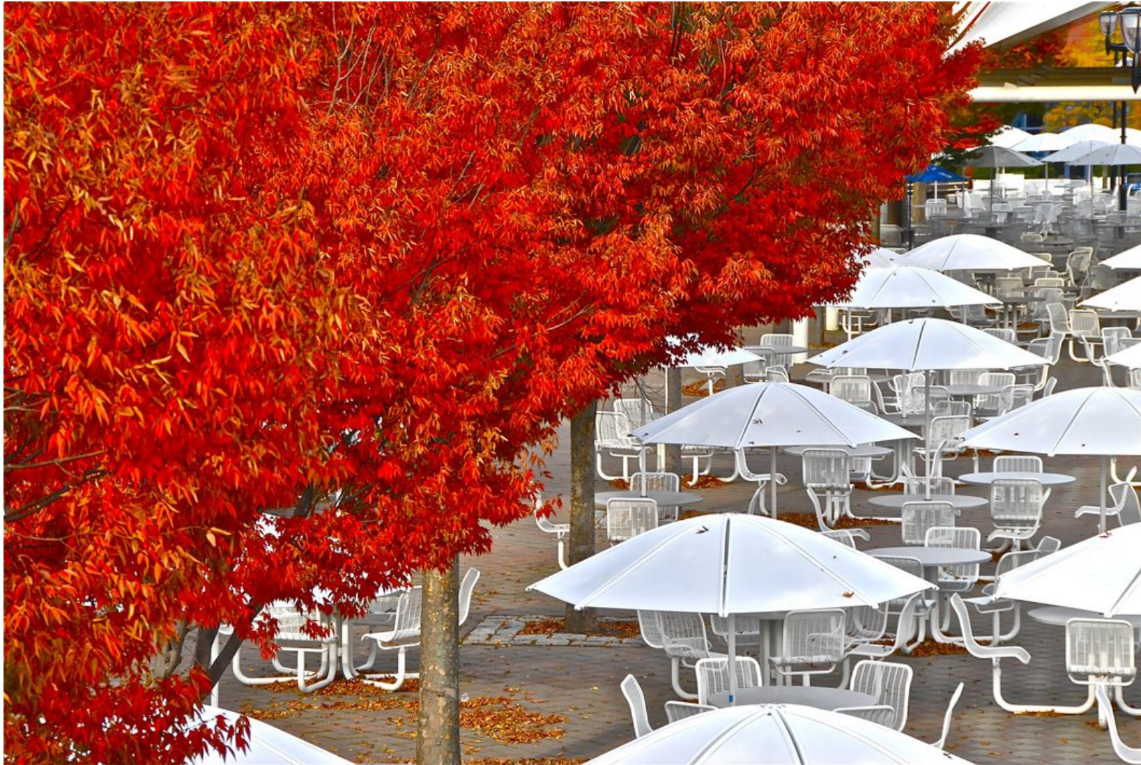
FLUSHING MEADOWS Impresión Digital en Sandwich Dibon blanco / Metacrilato / Bastidor Edición 1/3 - 70x100cm