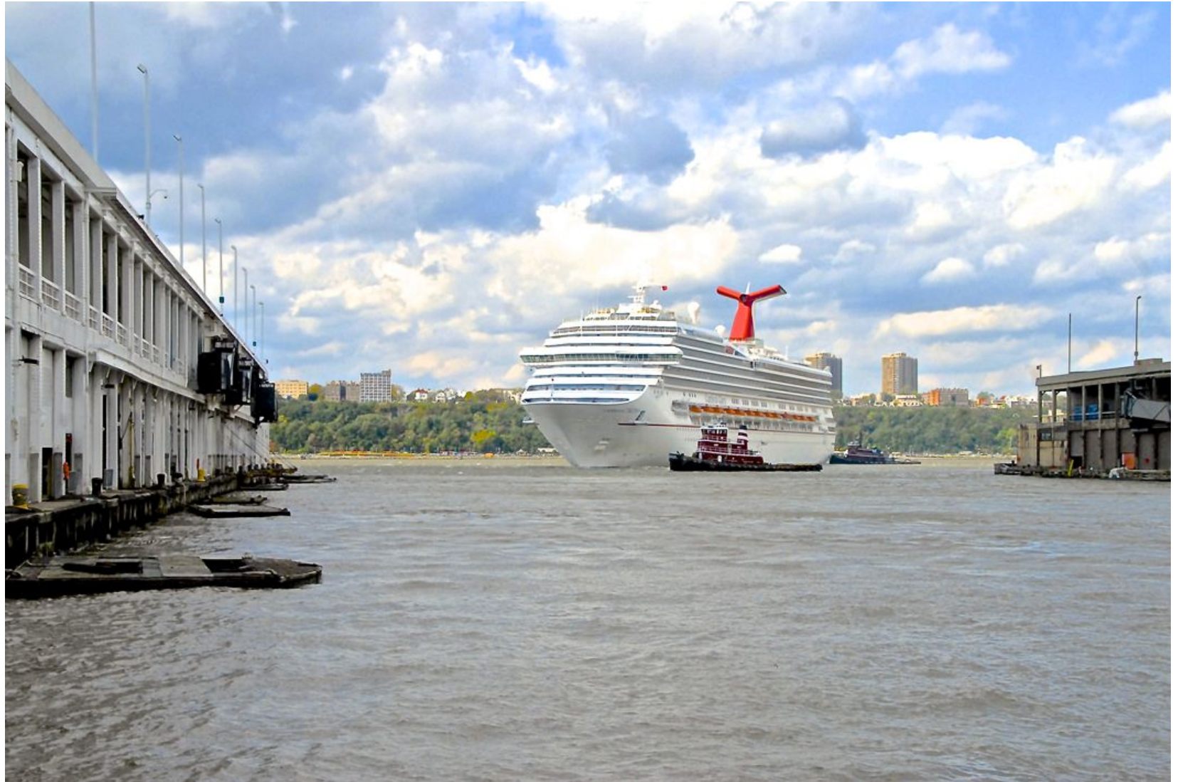
CRUCERO (RÍO HUDSON) Impresión Digital en Sandwich Dibon blanco / Metacrilato / Bastidor Edición 1/3 - 70x100cm