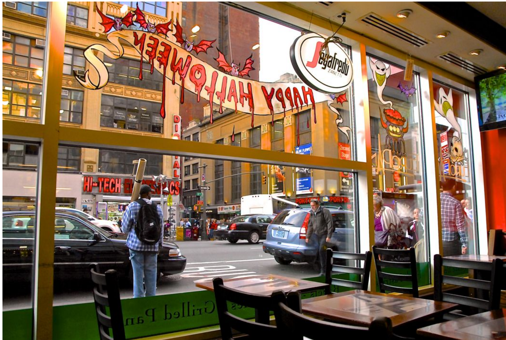
HAPPY HALLOWEEN Impresión Digital en Sandwich Dibon blanco / Metacrilato / Bastidor Edición 1/3 - 70x100cm