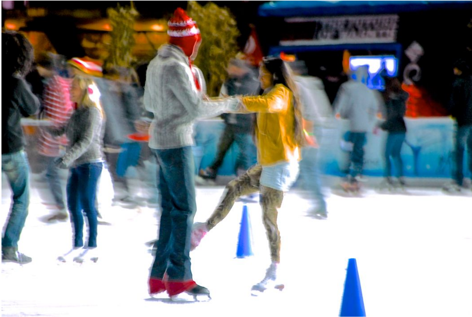
PATINADORES EN BRYANT PARK Impresión Digital en Sandwich Dibon blanco / Metacrilato / Bastidor Edición 1/3 - 70x100cm